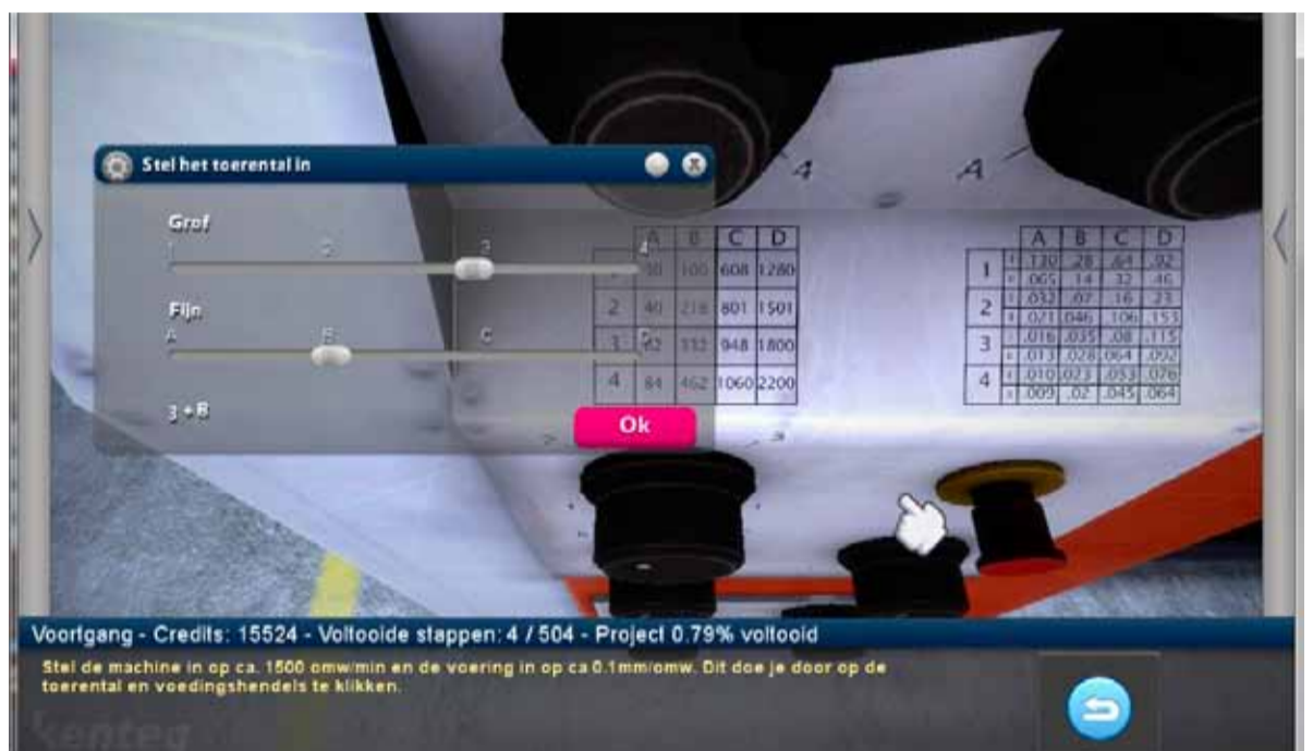
Een screenshot uit CRAFT. Op www.kenteqcrafft.nl kun je de game downloaden.

Al is het nog even wachten op de definitieve resultaten, toch durft Van Bussel een tipje van de sluier op te lichten. 'Het lijkt erop dat het inderdaad werkt', stelt hij voorzichtig vast.