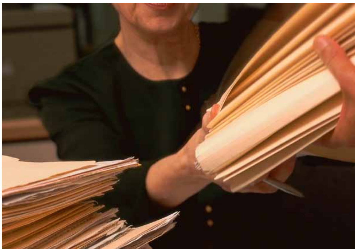
Dikke stapels papier behoren straks in de kwalificatiestructuur 3.0 tot het verleden.

De 20 randvoorwaarden vind je op www.http://bit.ly/briefaanSBB .