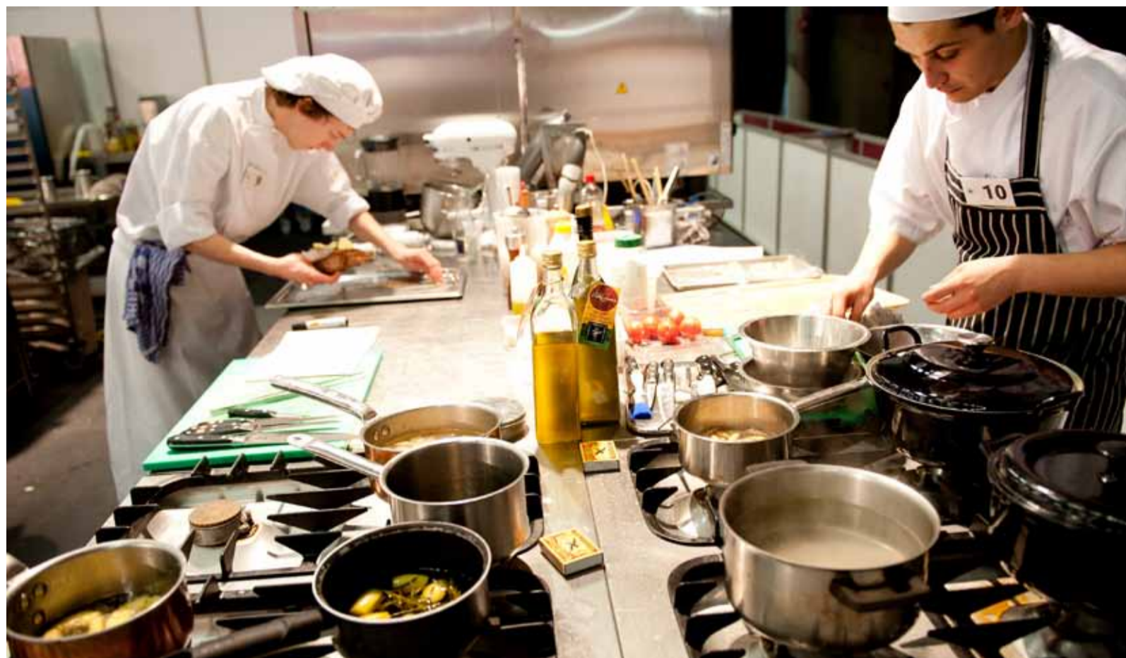
Studenten van de opleiding Kok, hier aan het werk tijdens de Skills Masters. Een werkgroep bestaande uit vertegenwoordigers van zes mbo-instellingen en het bedrijfsleven test momenteel het herziene kwalificatiedossier voor deze opleiding.