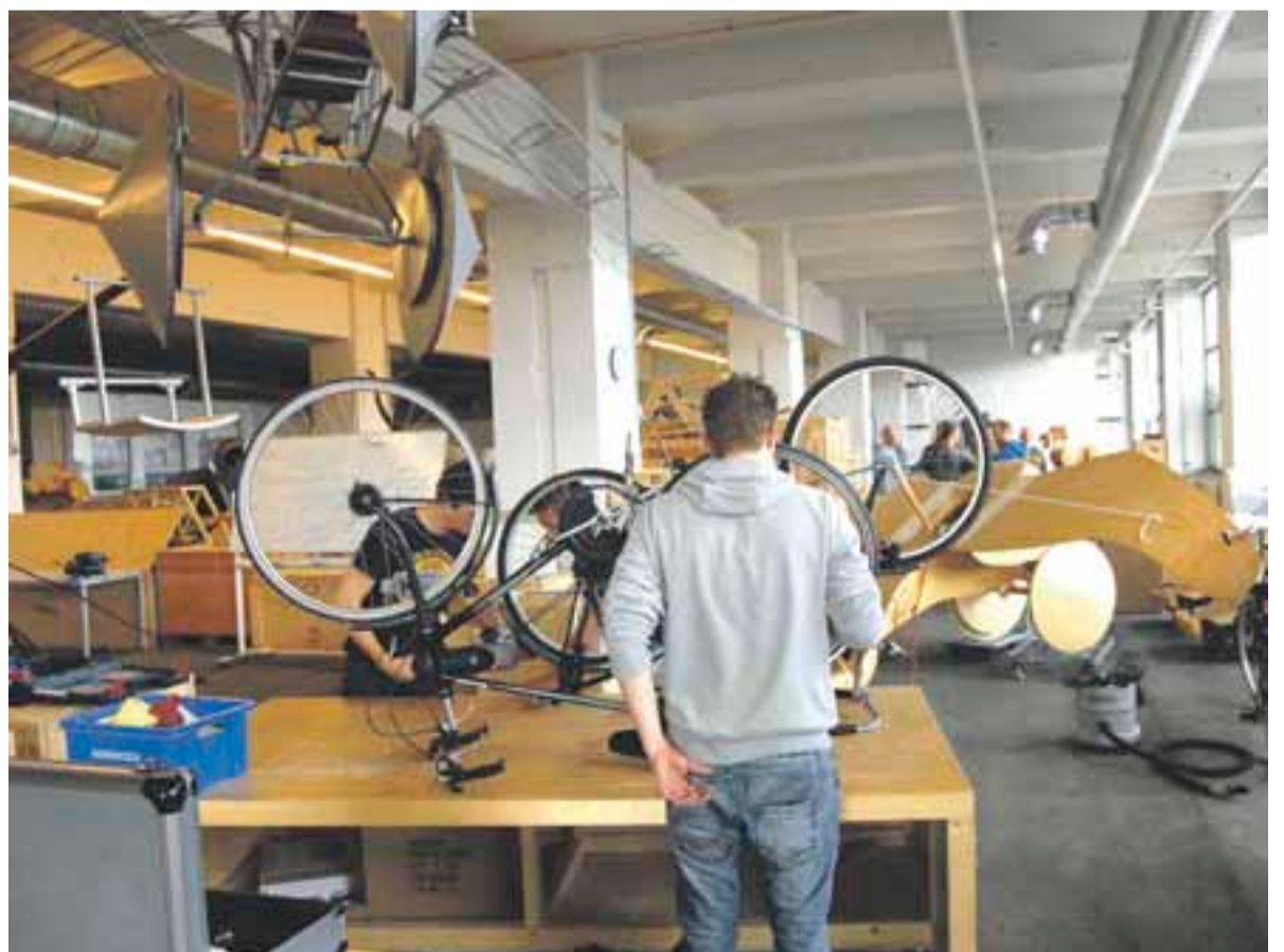
Studenten van de Netwerkschool in de weer in De Ontdekfabriek.

Sponsoring is een andere manier waarop de Netwerkschool verbinding zoekt met bedrijven. Vaessen: 'Als je een goed verhaal hebt, dragen bedrijven graag bij. Zo is er vorig jaar door onze studenten een rolstoelschommel voor een zorginstelling gebouwd; de frequentieschakelaar werd gesponsord.' Geert Croes: 'Maar we willen ook graag dat bedrijven meedenken over ons curriculum. Wat moeten onze studenten kunnen en kennen? Dat verlangt van ons dat we open staan en naar buiten gaan. En dat moeten we leren.'