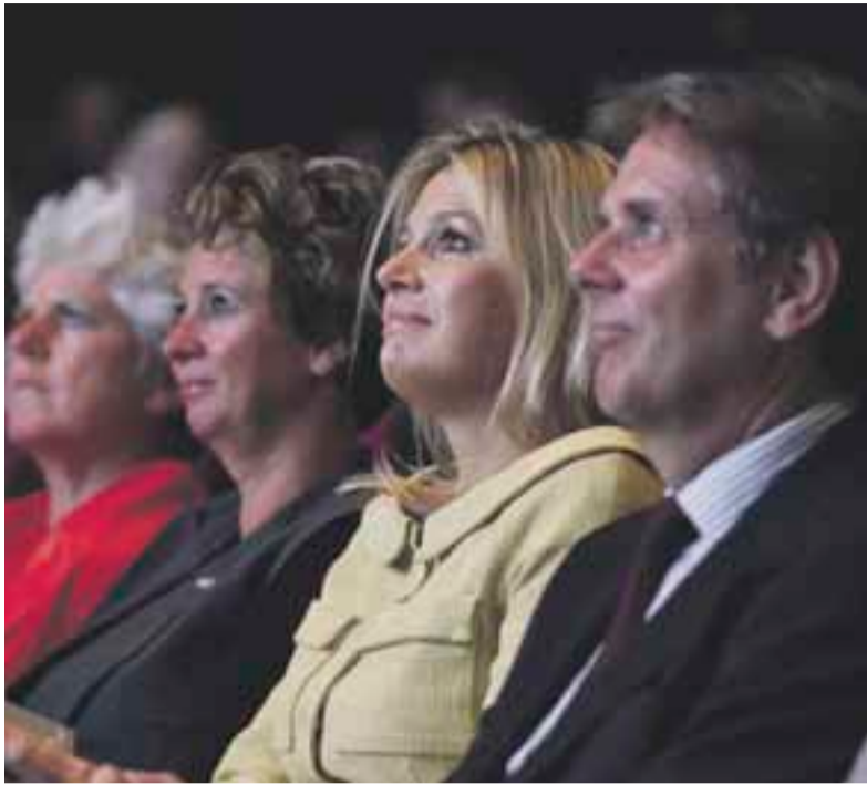
Prinses Máxima benadrukt met haar aanwezigheid op het Uitblinkersgala het belang van het mbo.