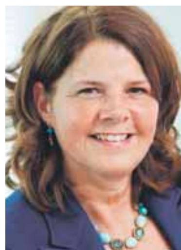
Van Bijsterveldt: 'uitzondering voor bepaalde opleidingen'

om voor bepaalde opleidingen een uitzondering te maken. Het aantal opleidingen dat wordt uitgezonderd van de verkortingsmaatregel bedraagt maximaal 15 procent van het aantal kwalificaties op niveau 4. Het gaat dan bijvoorbeeld om opleidingen in de sector techniek en bepaalde specialistische opleidingen in de zorgsector. De minister heeft aan de Stichting Beroepsonderwijs Bedrijfsleven (SBB) gevraagd welke opleidingen voor deze uitzonde-